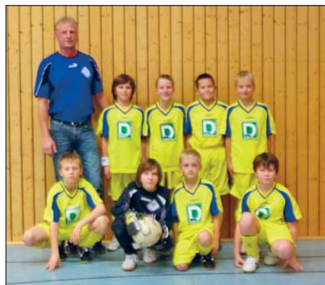
Die Teilnehmer des Hallenturniers

So war es sehr erfreulich, dass gleich im ersten Turnier beide Mannschaften die Endrunde des