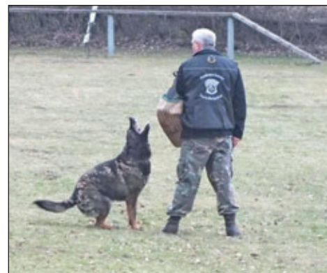
Hundesportverein Taura – Burgstädt e.V.