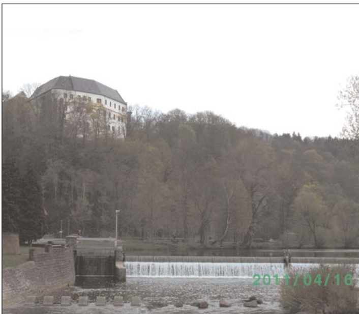
Blick zur Sachsenburg

Richtung Sachsenburg weitete sich das Tal und wir liefen auf einer schmalen Straße in mitten einer Wiesenlandschaft. Unterhalb der Sachsenburg überquerte die Wandergruppe den Zschopaufluss auf einer Hängebrücke, die trotz vorsichtigen Laufens stark schaukelte. Man konnte an dieser Stelle das Panorama „Hängebrücke - Flusswehr mit Überlauf - Sachsenburg auf Felsen“ genießen, was wir auch ausgiebig taten. Nach einiger Diskussion entschlossen wir uns, doch die steile Treppe zur Sachsenburg empor zu steigen. Die Sachsenburg selbst ist noch stark renovierungsbedürftig, aber man konnte sich im Hof die Wagen des historischen Besiedlungszuges anschauen.