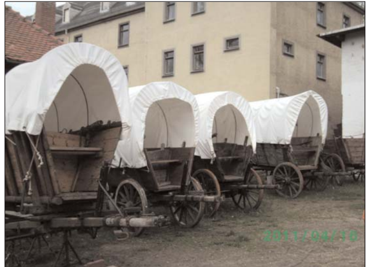
Wagen historischer Besiedlungszug

Wir gingen dann an der Straße zurück zum Zschopaufluss, sodass unsere Wandergruppe gegen 12:30 Uhr an der Fischerschänke eintraf, wo Plätze für uns bestellt waren. Wir nahmen Platz in der gemütlichen Gaststube, Essen und Getränke waren zügig bestellt und wir unterhielten uns angeregt über die Gegend dort. Die Speisen mundeten allen vorzüglich und man war nach dieser Stärkung für neue Taten bereit. Unser weiterer Wanderweg führte nun wieder flussabwärts und wir gingen einen schönen Waldweg entlang. Von der Höhe aus sah man das Zschopautal vor sich liegen. Wir blickten auf den Fluss mit seinen Biegungen und einen wunderschönen, wilden Auenwald. Nach einer guten Stunde erreichten wir die Anlegestelle der Seilfähre „Anna“ bei Krumbach. Der Fährmann hatte uns bereits entdeckt und zog sein Boot eifrig zu unserem Ufer herüber. Die Wandergruppe stieg vorsichtig in die Fähre und nahm Platz auf den Bänken.