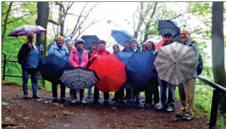
„Bei schönen Wetter kann jeder“