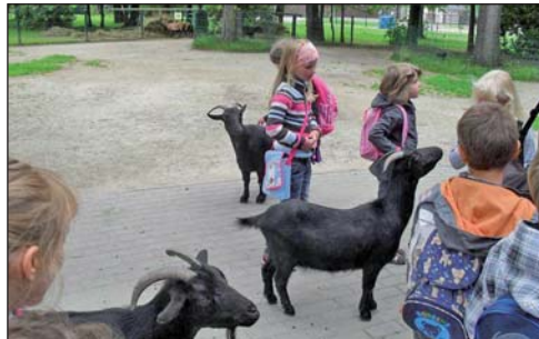
In der Pelzmühle.