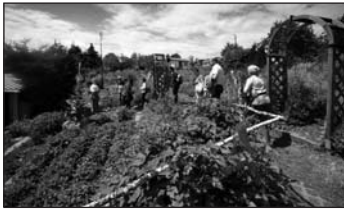
Das Kräuterzentrum Lunzenau kann jeden Tag kostenfrei besucht werden. Derzeit zeigen die Pflanzen ihre schönste Pracht.

Sonntag, 28. August 2011, ab 11 Uhr: Kräuterbüfett, 14 Uhr: Kräuterführung