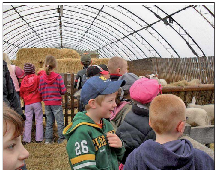
In der Schäferei in Claußnitz