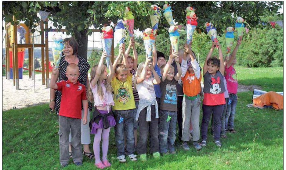
Nach der Zuckertütenerte