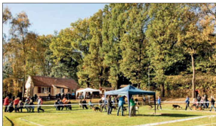
Impressionen der 26. Taurastein - Zuchtschau 2017