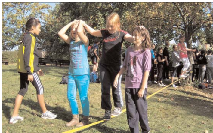
Klasse 5a beim Slackline