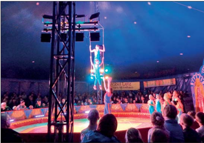
Die Kinder und das Team der Johann-Esche-Grundschule