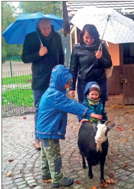
Das Team der Kita „Rasselbande“ Johanniter-Unfall-Hilfe e.V., RV Meißen/Mittelsachsen