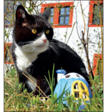
Die Bilder zeigen den „echten“ Kater Arthur von Schloss Rochsburg.