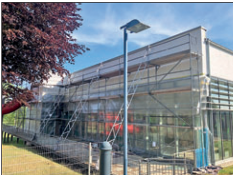
Fassadenarbeiten am Sportzentrum