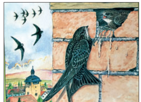
Mauersegler am Brutplatz Originalzeichnung: Friedhelm Weick

Der Mauersegler bevorzugt hochgelegene Brutmöglichkeiten, um mit seinen sichelförmigen Flügeln genug Auftrieb zu garantieren. Deshalb ist es ratsam, einen auf dem Boden gefundenen Segler aufzunehmen und hoch in die Luft zu werfen, um ihm „Starthilfe“ zu geben. Er kann weder laufen noch hüpfen. Seine Füße sind für das Festhalten an senkrechten Wänden ausgebildet, weshalb auch die vierte Zehe nach vorn gerichtet ist. Einfarbig schwarz mit einer weißlichen Kehle und den sichelförmigen Flügeln jagen Mauersegler rasant mit einem schrillen srie durch die Luft und sind dadurch von Schwalben zu unterscheiden. Mit wenigen Ausnahmen sind sie ihr Leben lang ständig in der Luft. Selbst die Kopulation und das Schlafen findet in größeren Höhen statt.