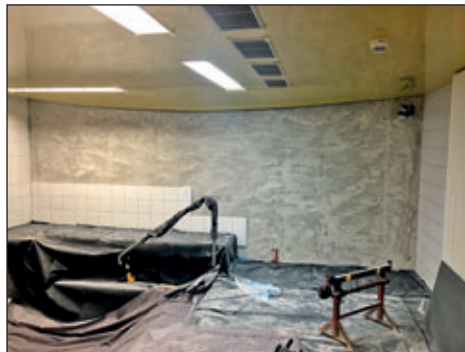
Fliesenarbeiten im Rutschenlandebecken